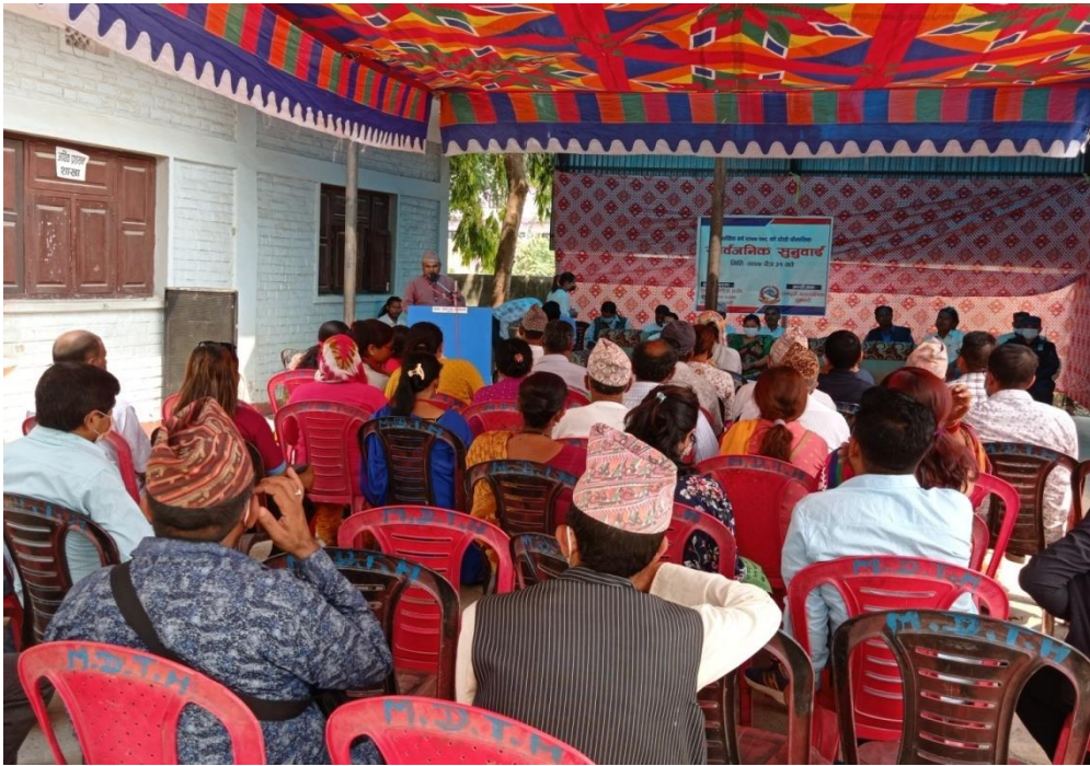
सार्वजानीक सुनुवाई कार्यक्रमका सहभागीहरुले अफना भनाई राख्दै