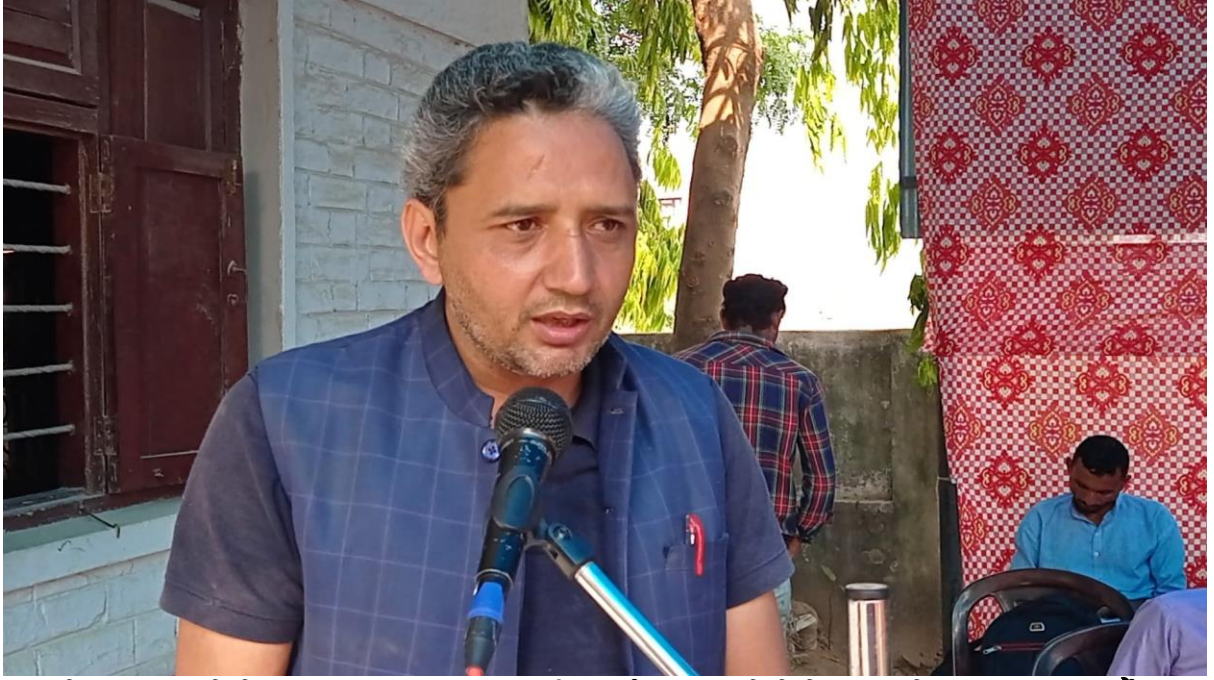
बिषयगत समिति र सेवा प्रदायक सरकारी कार्यलयका प्रतिनिधिबाट प्रतिवेदन प्रस्तुत गर्दै