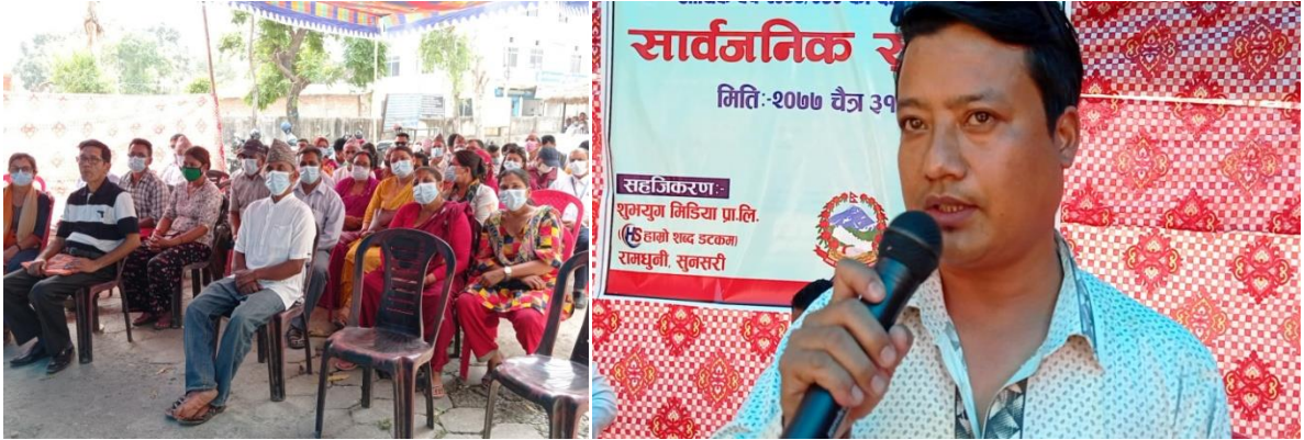
सार्वजनिक सुनुवाई कार्यक्रममा सहभागीहरु प्रश्न गर्दै