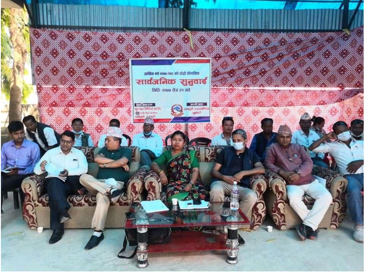
दोस्रो सार्वजनिक सुनुवाई कार्यक्रममा उपस्थित सरोकारवालाहरु